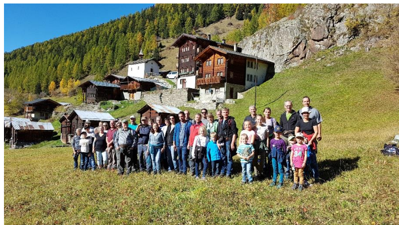
Vereinsausflug 2017 im Lötschental

Generalversammlung 2019: 26. Januar 2019 - Olten